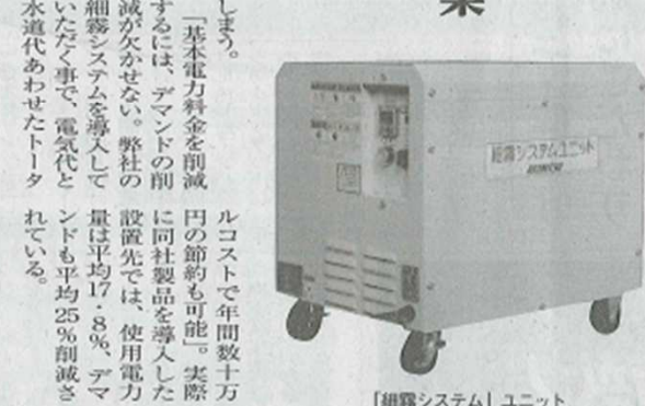
「細霧システム」ユニット